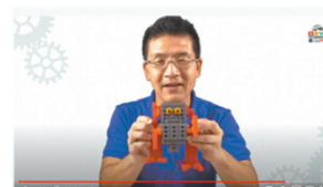
動きのメカニズム等や着目ポイントも解説